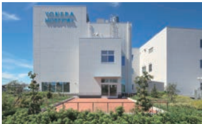
リハビリ室(病院)に直結した屋外テラス