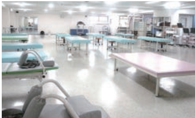
310㎡の広々としたリハビリ室(クリニック1F)