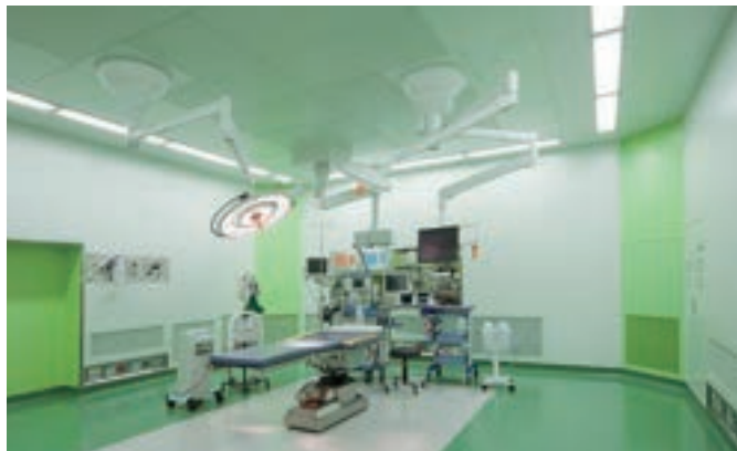
整形外科に特化した手術室(3室)