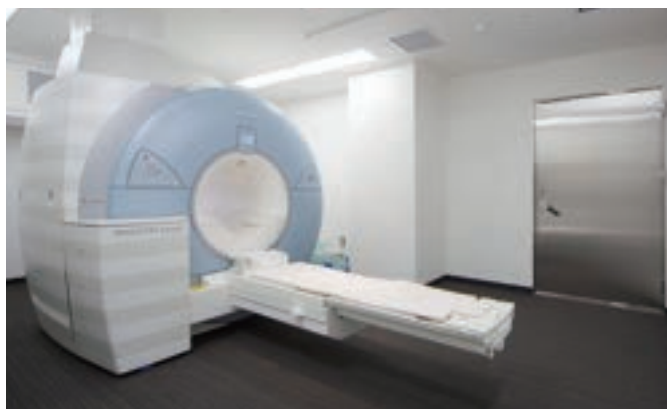
MRI(2機)をはじめとする様々な検査機器