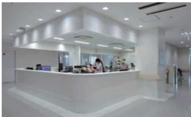
患者さんにもスタッフにも優しい ワンフロアの整形外科病棟(54床)