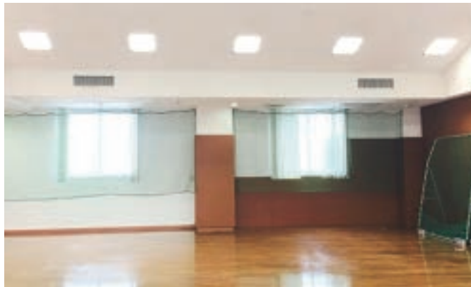
アスリハも可能なリハビリ室(クリニック2F)