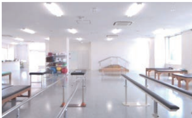
280㎡の広々としたリハビリ室(病院)